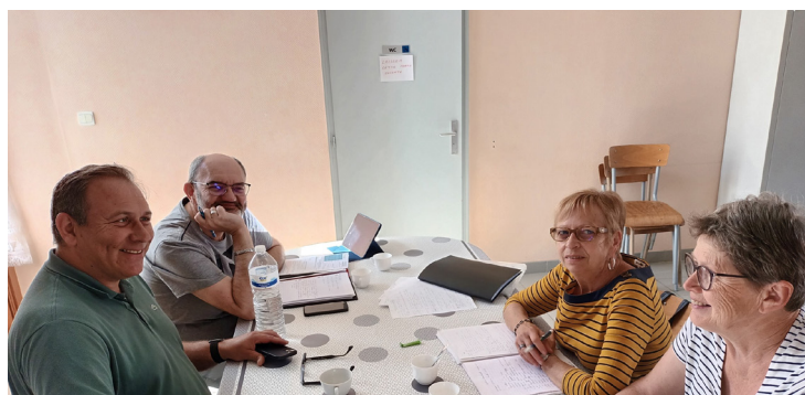
La Commission Communication au travail !